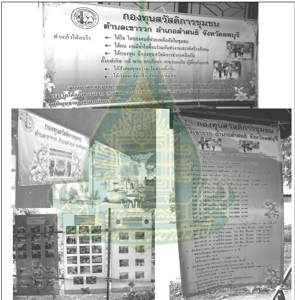
ภาพที่ 6.14 ป้ายประชาสัมพันธ์ นิทรรศการประชาสัมพันธ์กองทุนสวัสดิการชุมชนตำบลเขารวก