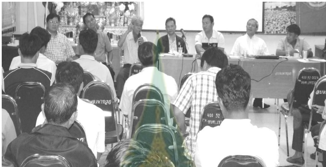
ภาพที่ 6.15 การแลกเปลี่ยนเรียนรู้ร่วมกันระหว่างกรรมการและสมาชิก กองทุนสวัสดิการชุมชนต่างๆ ในอำเภอลำสนธิ

หน่วยงาน องค์กรต่างๆ ที่เกี่ยวข้อง ได้แก่ องค์กรบริหารส่วนตำบลเขารวก องค์กรบริหารส่วนตำบลเขาน้อย สภาองค์กรชุมชนจังหวัดลพบุรี สถาบันพัฒนาองค์กรชุมชน ศูนย์พัฒนาสังคมหน่วยที่ 50 สำนักงานส่งเสริมและสนับสนุนวิชาการ 8 และสำนักงานพัฒนาสังคมและความมั่นคงของมนุษย์จังหวัดลพบุรี