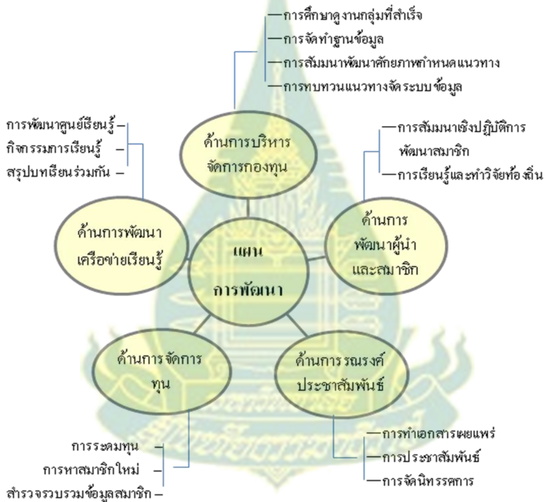
ภาพที่ 6.17 สรุปแผนการพัฒนาและกิจกรรมที่กองทุนสวัสดิการชุมชนตำบลเขารวก ที่ขับเคลื่อนในงานวิจัย

จากที่กล่าวมาเป็นแนวทางการดำเนินการ กิจกรรม และผลการพัฒนากองทุนสวัสดิการชุมชน ตำบลเขารวกตามแนวปรัชญาเศรษฐกิจพอเพียง ที่ชุมชนได้มีการปฏิบัติการในการวิจัยและได้วิเคราะห์ผล จากการดำเนินการในด้านต่างๆ ร่วมกัน โดยสรุปแผนการพัฒนาและกิจกรรมที่กองทุนสวัสดิการชุมชน ตำบลเขารวกที่ขับเคลื่อนในการวิจัย ดังภาพที่ 6.17