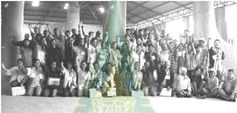
ภาพที่ 6.10 การจัดสัมมนาเชิงปฏิบัติการ “การเสริมสร้างศักยภาพและการกำหนดแนวทางการพัฒนาสวัสดิการตำบลเขารวก”