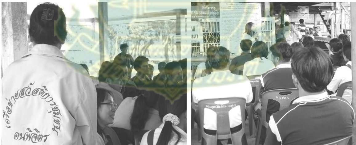
ภาพที่ 6.1 กิจกรรมการศึกษาดูงานจากกองทุนที่ประสบความสำเร็จ