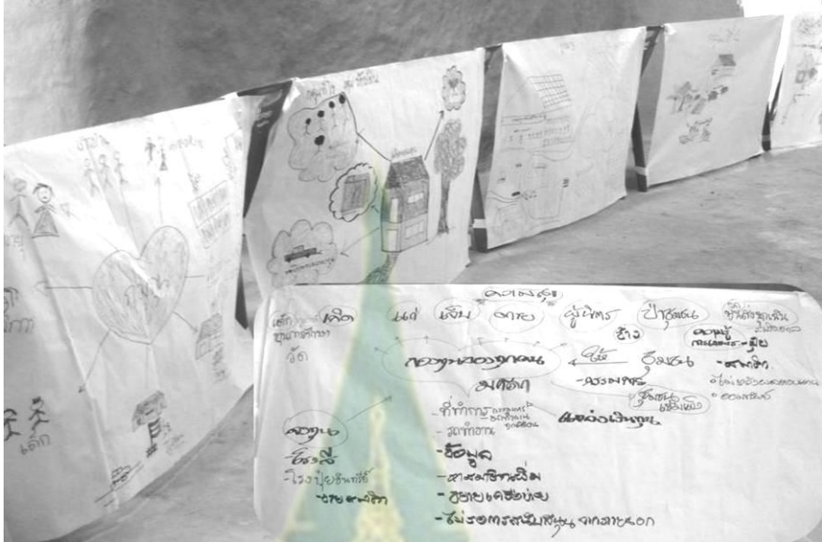
ภาพที่ 6.8 การกำหนดเป้าหมายกองทุนสวัสดิการชุมชนตำบลเขารวกในอนาคตอันใกล้