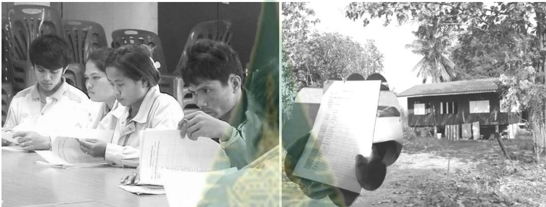
ภาพที่ 6.3 การสำรวจข้อมูลเกี่ยวกับสวัสดิการชุมชนในตำบลเขารวกโดยนักวิจัยชาวบ้าน