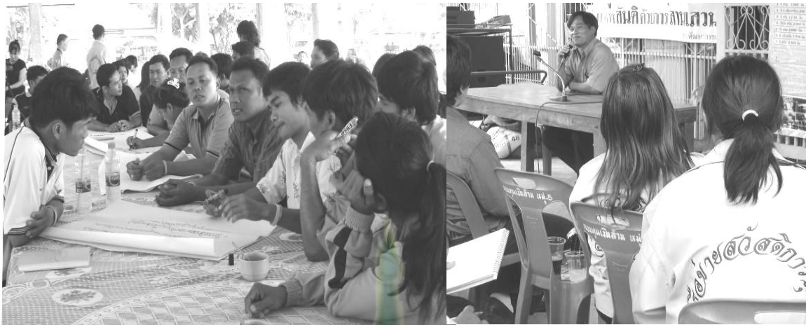
ภาพที่ 6.2 สรุปบทเรียนจากการศึกษาดูงาน