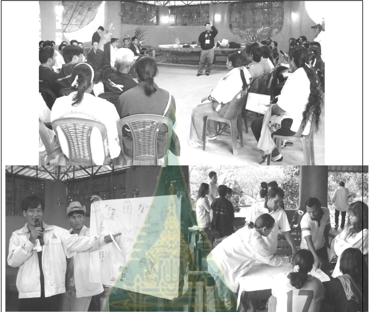
ภาพที่ 6.6 การสัมมนาเชิงปฏิบัติการเพื่อหาแนวทางพัฒนากองทุนสวัสดิการชุมชนตำบลเขารวก