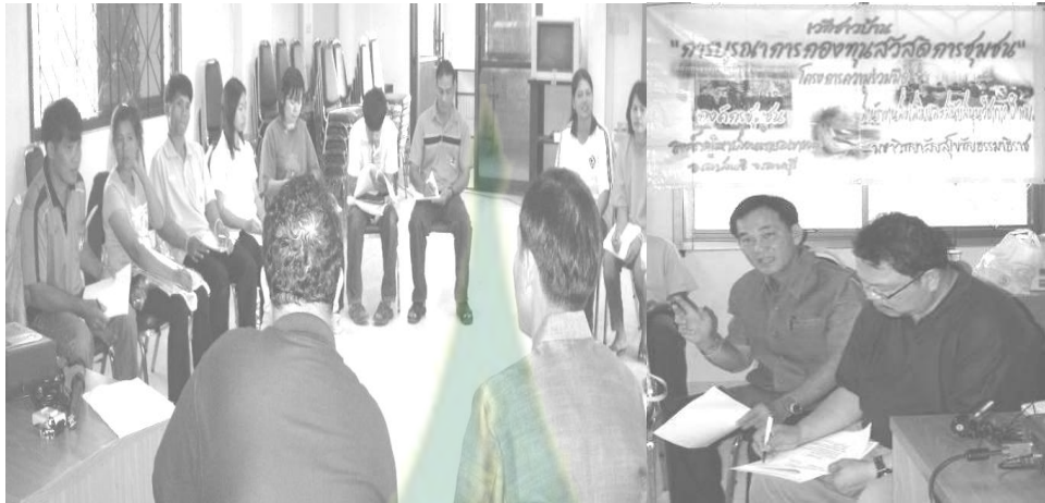
ภาพที่ 6.11 การประชุมร่วมกันระหว่างนักวิจัยชาวบ้าน นักวิจัย มสธ. และ ผอ. สสว.8