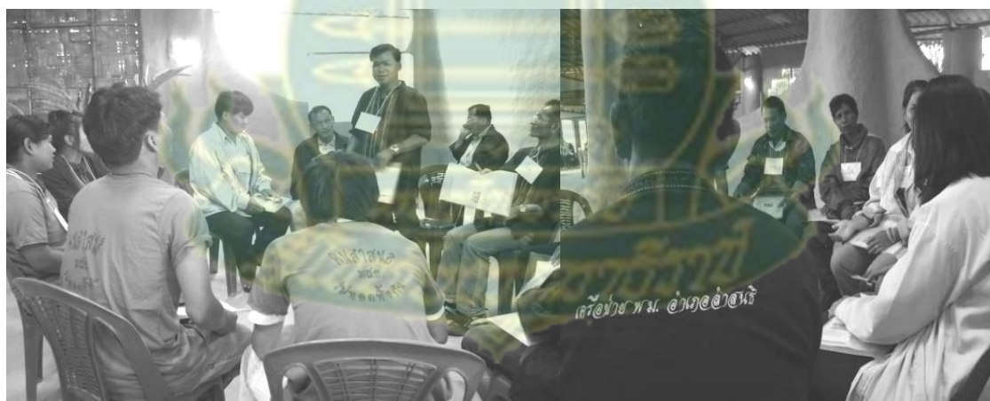
ภาพที่ 6.15 การแลกเปลี่ยนเรียนรู้ร่วมกันระหว่างกรรมการและสมาชิก กองทุนสวัสดิการชุมชนต่างๆ ในอำเภอลำสนธิ