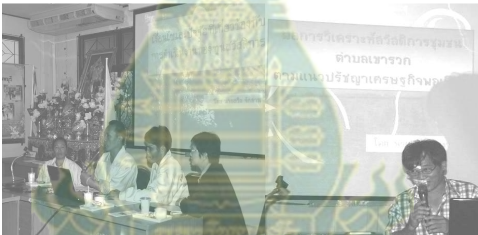
ภาพที่ 6.12 การเสนอผลการวิจัยโดยนักวิจัยชาวบ้าน