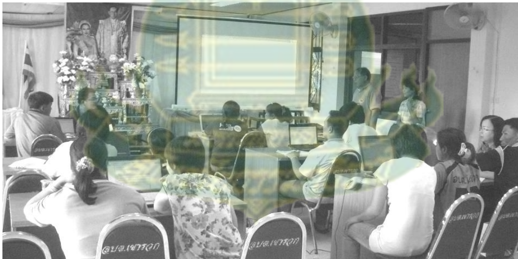
ภาพที่ 6.4 การจัดทำฐานข้อมูลเกี่ยวกับสวัสดิการชุมชนในตำบลเขารวกโดยนักวิจัยชาวบ้าน